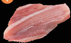
Pangasius filety s přidanou vodou