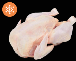
Kuře cca 1,8 - 2 kg