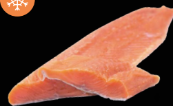
Losos filety s kůží 15% cca 250 - 600 g