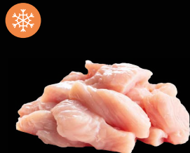
Krůtí medailonky prsni 80 - 100 g