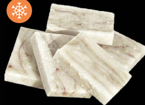
Filé porce Exclusive 150 g