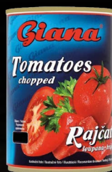
Rajčata sekaná, plech