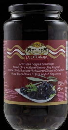
Olivy černé krájené 935 g