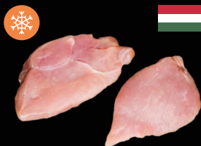
Krůtí steak cca 2 kg