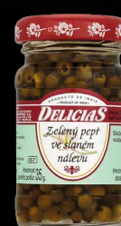
Zelený pepř v nálevu