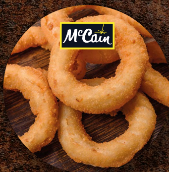
Cibulové kroužky v pивním těstíčku