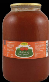
Koncentrovaný protlak rajský, sklo 3 × 4l