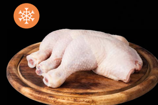
Kuřecí stehna 260 g