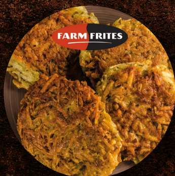
Bramborák 60 g