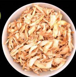
Hlíva ústříčná krájená