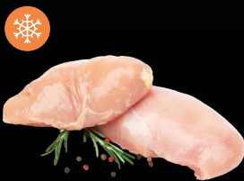
Kuřecí prsa IQF