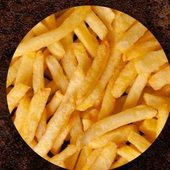
Hranolky Belgie 7 × 7