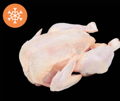
Kuře 1,3 kg