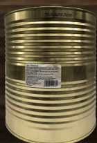
Zelí červené, plech