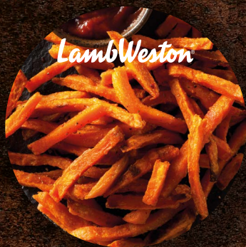
Bataty Sweet Potato 10 × 10