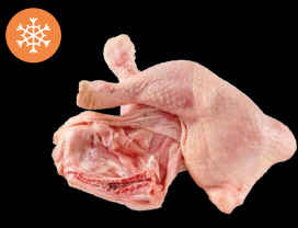
Kuřecí čtvrtky IQF