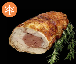
Kuřecí roláda plněná