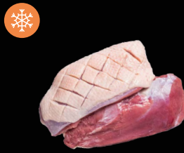
Kachní prsa cca 250 - 300 g