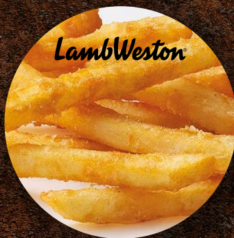
Crispy Fries hranolky Regular 9 × 9 Dubaj