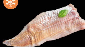
Treska tmavá IQF, 10% glazura