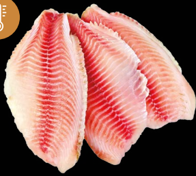
Tilapie filety glazura 5% IQF 80 - 130 g