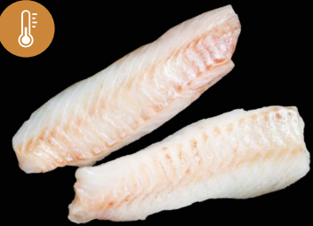
Aljašská treska loins (svíčková) 10% glazura, 90 - 120 g