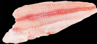
Sumeček africký filety bez kůže IQF, 10% glazura, 400 g