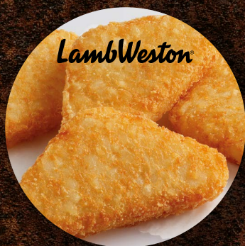
Taštička bramborová 75 g