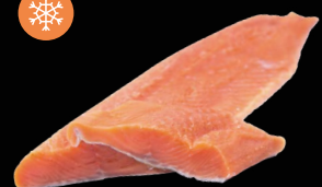
Losos filety s kůží 10% cca 600 - 1000 g