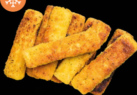
Rybí prsty nemleté 5 kg