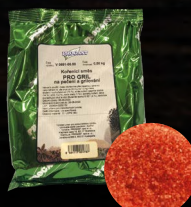
Grilovací koření (pro gril)