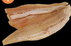
Filé Hejk interleaved bez kůže