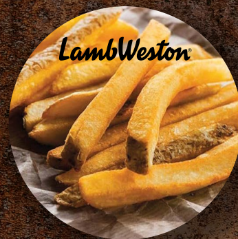
Hranolky Stealth A se slupkou 11 × 11