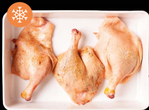
Huso-kachní stehna Barberie pižmovky 300 - 400 g