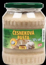
Česneková pasta 30%, sklo