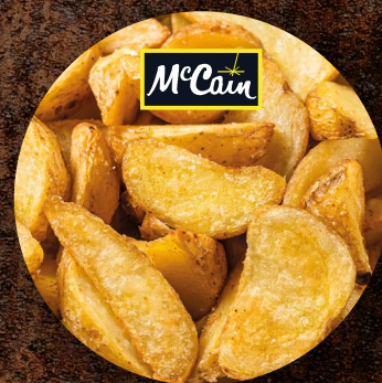
Americké brambory B