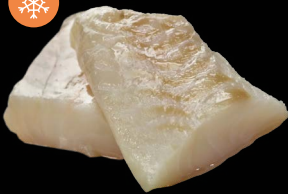
Aljašská treska IQF 120 - 240 g