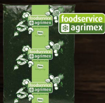
Špenát řezaný (protlak)