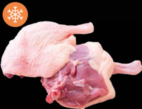
Kachní čtvrtky 380 - 420 g