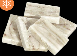
Filé porce Exclusive 100 g