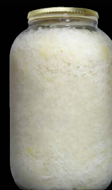
Zelí kysané, sklo 1 × 4l