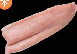
Pstruh duhový 200 - 250 g