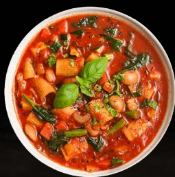
Minestrone - zeleninová