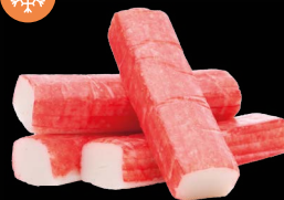
Krabí tyčinky -Surimi