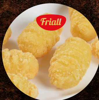
Krokety do trouby - válečky